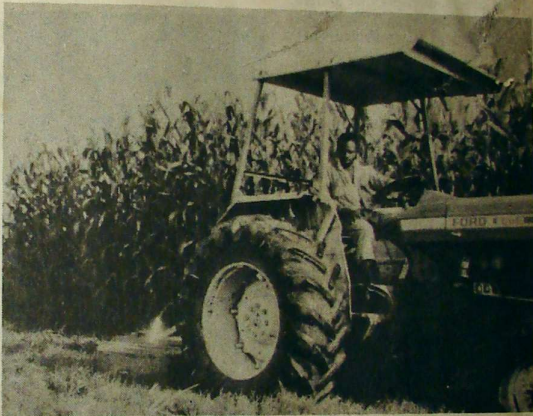
Als voornamste gasten komen wordt het te hoge gras nog eens gemaaid...

T och wordt op de lange duur voor een bedrijf zoals het onze het knelpunt niet zozeer de maisprijs, maar wel de toestand van het machinepark. Waar gaan we straks nieuwe machines vandaan halen als Nederland eens besluit om de helpende hand terug te trekken? Verdienen we dan helemaal niks aan die mais?? Jawel, maar we worden betaald met "monopoliegeld", want veel meer betekend helaas de Tanzaniaanse shilling niet als je er mee over de grenzen gaat. Alles moet hier gemechaniseerd gaan gebeuren. Dat is een fraai streven, maar in de huidige toe-