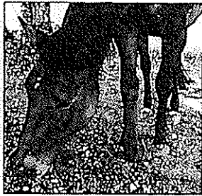
Ikarus geniesst den Weidedegang.

Ikarus wälzt sich genüsslich auf der Weide. Kraft und Lebensfreude pur strahlt das fast 21-jährige Schweizer Warmblut aus. Gemächlich schliesst er sich danach seinem älteren Kameraden Salinero an, der ebenfalls gemütlich auf der Weide grasst. Beide Pferde haben eines gemeinsam: Alle beide wären sie jetzt nicht mehr am Leben!