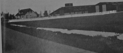
Het fraaie nieuwe bedrijf dat totaal een investering heeft gevergd van ruim een miljoen gulden