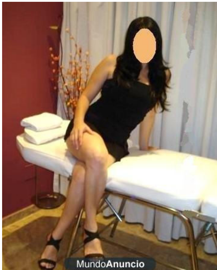
Foto de MASAJES RELAJANTES DENTRO O FUERA DE LA CAMARA A VAPOR CON UNA EXFOCIACION - Lima Metropolitana - 2

Foto de MASAJES RELAJANTES DENTRO O FUERA DE LA CAMARA A VAPOR CON UNA EXFOCIACION - Lima Metropolitana - 1