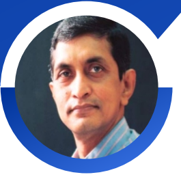
Dr. Jayaprakash Naaraayan MLA (A.P.), Ex-IAS Founder and National President Loksatta Party

ಮಹಾ ಸಿನಿಕತನ, ಸ್ವಯಂ ಅನುಮಾನ ಪ್ರವೃತ್ತಿಯೇ ತಾಂಡವವಾಡುತ್ತಿರುವ ಈ ಹೊತ್ತಿನಲ್ಲಿ ನಮ್ಮ ಯುವಜನತೆ ಯಾವ ಆದರ್ಶ, ಉತ್ಸಾಹ, ತ್ಯಾಗ ಮನೋಭಾವಕ್ಕೂ ಬದ್ಧತೆಗೂ ಕಡಿಮೆ ಇಲ್ಲದವರೆಂದು ತೋರಿಸಿಕೊಟ್ಟಿದ್ದಾರೆ. ಅದಕ್ಕಾಗಿ ಅವರನ್ನು ನಾನು ವಂದಿಸುತ್ತೇನೆ.