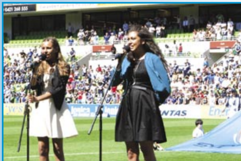
The Dean Sisters singing the national anthem photos