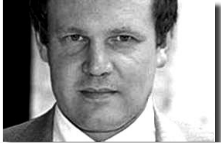
بيتر أوبورن ، رئيس قسم التحليل السياسي بالقارديان